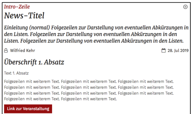
Tabelle: Inhaltstypen (Element) - Aufmacher-Variante - Detailansicht